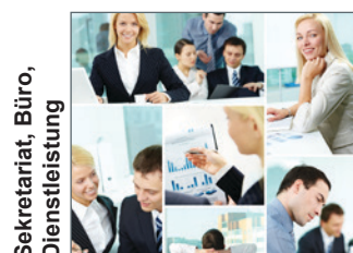
Sekretariat, Büro, Dienstleistung