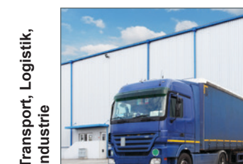
Transport, Logistik, Industrie