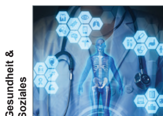
Gesundheit &amp; Soziales