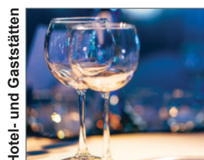
Hotel- und Gaststätten