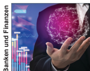
Banken und Finanzen