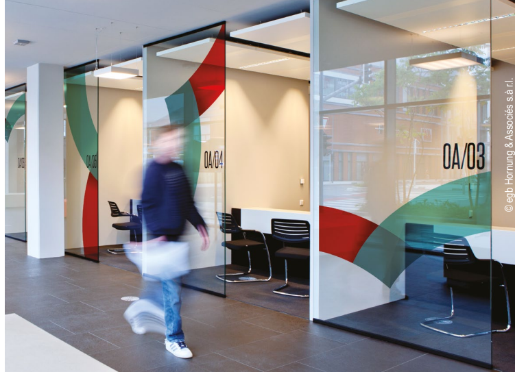
© egb Hornung & Associés s.à r.l.

Garantir a aplicação da legislação referente à prevenção do desemprego, à redução do desemprego, à atribuição dos subsídios de desemprego e às ajudas para promover o emprego.